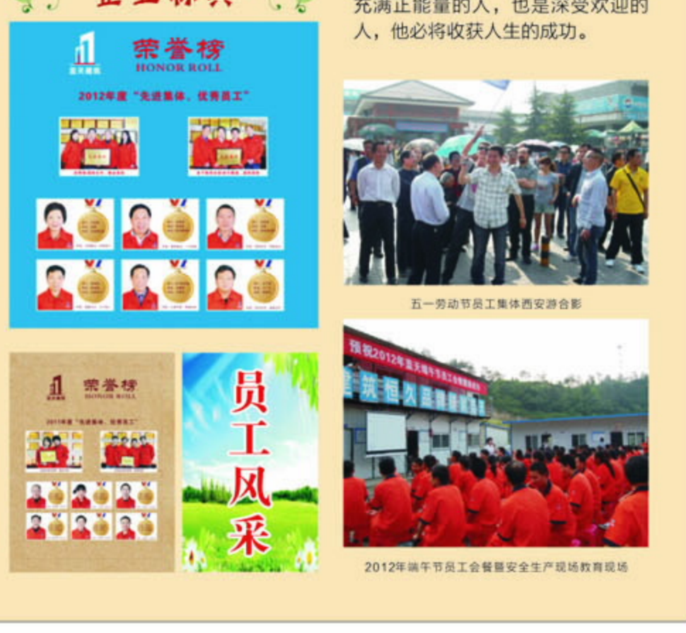
五一劳动节员工集体聚餐合影。

环境你周围的人,他们在工作中,做好了自己,认清自己应当如何去,不足和差距就出来了。