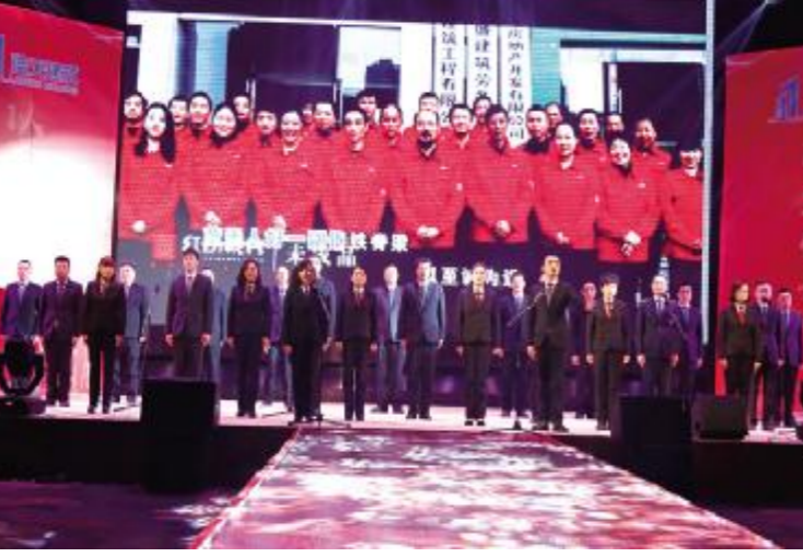
员工合唱司歌——《梦翔蓝天》