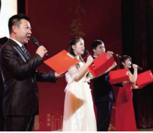
沙画配乐诗朗诵表演——《蓝天赋》