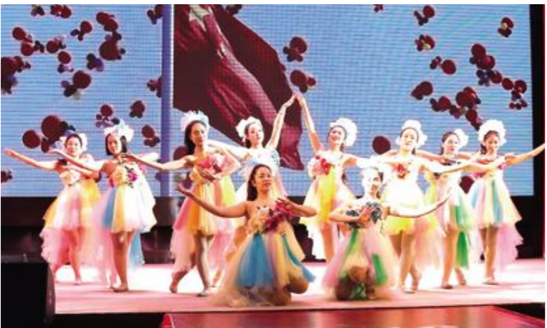
民族舞蹈——《不忘初心》