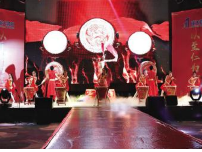
开场鼓舞——《十全十美》