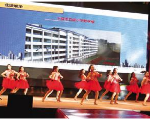
快板舞——《我骄傲,我是蓝天人》